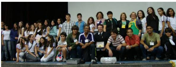
Teatro em BH - 2010