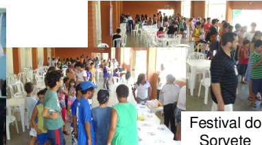
Festival do Sorvete