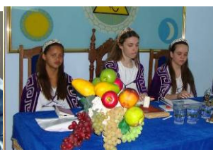
Nova Tríade - XVII gestão