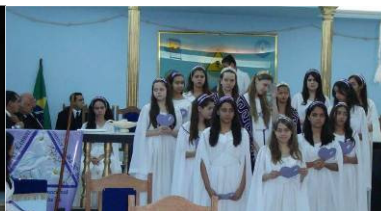
Dia dos Pais - 2010