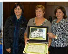
Homenagem tia Pinheiro