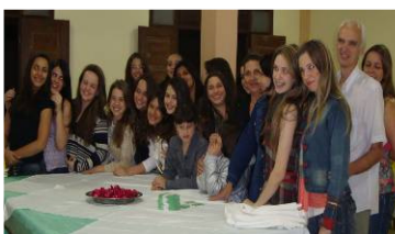
Aniversário do Bethel