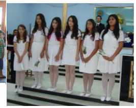
Iniciação - 12/jun