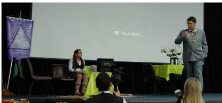
Teatro em BH - 2010