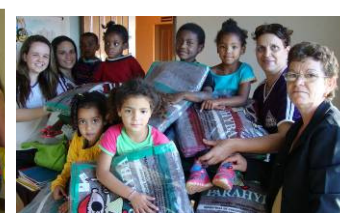
Entrega de Cobertores - 2010