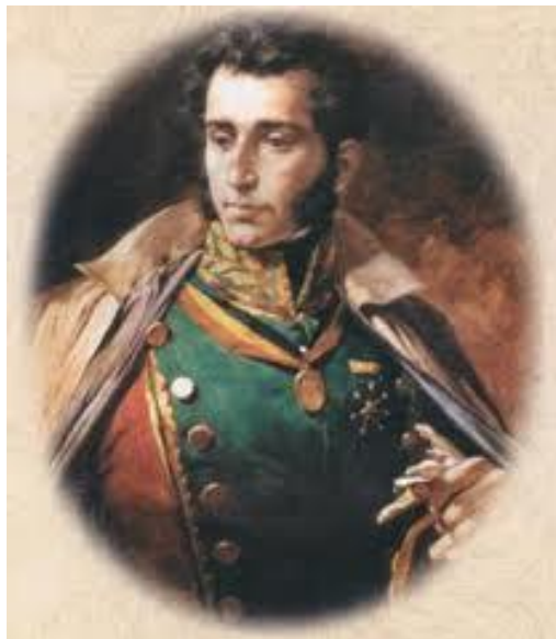
Gran Mariscal Antonio José de Sucre

B.:R.:L.:S.: "Antonio José de Sucre Nº 125"