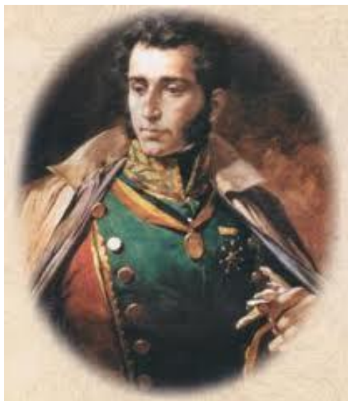
Gran Mariscal Antonio José de Sucre

B.:R.:L.:S.: "Antonio José de Sucre Nº 125"