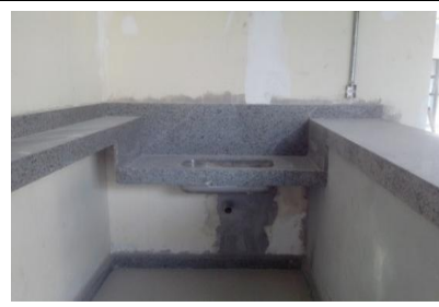
Copa da sala de administração/GOB no nível +9,50