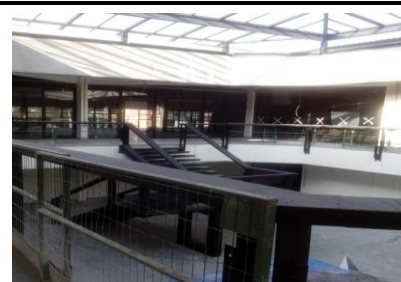
Guarda-Corpo grande átrio