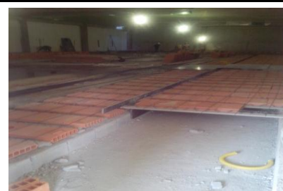
Execução lajes treliçadas Templo Nobre