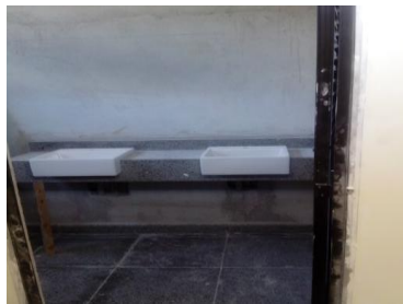
Banheiro I.S.M Nível +5,50