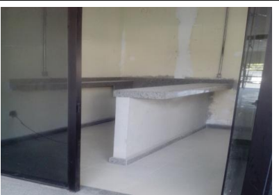
Copa da sala de administração/GOB no nível +9,50