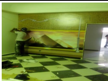
Adesivamento Templo 3