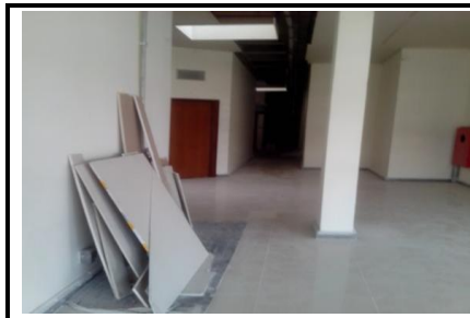
Área circulação gabinetes no nível +9,50