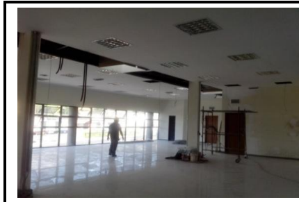
Forro de gesso e luminárias sala Administração/GOB