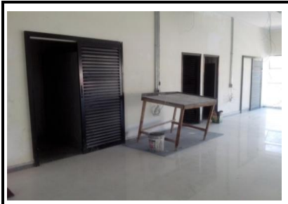
Esquadrias banheiros sala Administração/GOB no nível +9,50