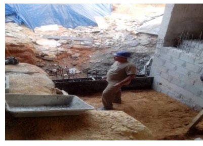
Concretagem muro de arrimo lado esquerdo