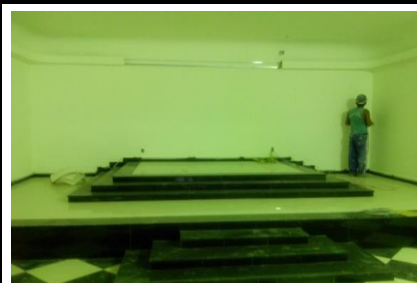
Altar Templo 3