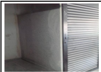
Divisórias banheiro Administração/GOB