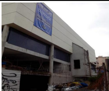
Fachada Av. Cristiano Machado lado esquerdo