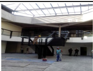
Escada Grande Átrio