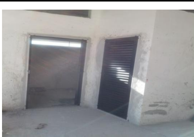
Esquadrias banheiro I.S.F E I.S DEF no Nível +5,50 lado esquerdo