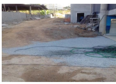
Rampamento lado direito e Nivelamento acesso Garagem Nível +2,35