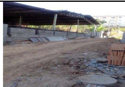
Execução do muro da divisa