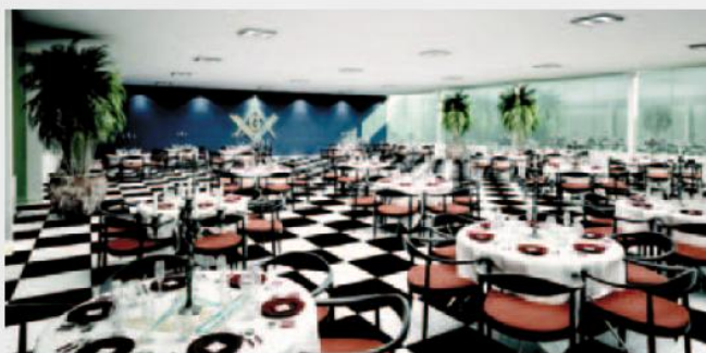
SALÃO DE FESTAS Amplamente confortável e aconchegante, com áreas externas e internas, três ambientes simultâneos com acomodações para 500 pessoas.