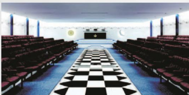
TEMPLO NOBRE Acomodações para 390 pessoas, bem-estar e segurança para a irmandade.

Qualquer informação com a: SMI - Sociedade Maçônica de Investimentos S/A Av. Cristiano Machado, 10.169 - Bairro Heliópolis CEP 31760-000 Belo Horizonte-MG Tel (31) 3343-3917 - E-mail: smisa@smisa.com.br ou através do site: www.smisa.com.br