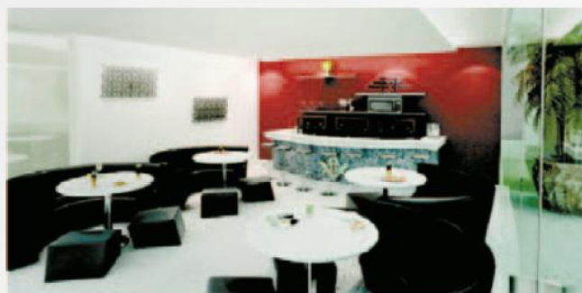
SCOTT BAR Possui um espaço com área interna e pequena varanda com capacidade para até 50 pessoas. Ideal para o happy hour ou encontros sociais.