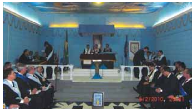
Regularização da Loja Fraternidade da Pedra, número 4012