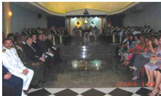
Sessão Magna na Loja Fraternidade de Santos. Inúmeras autoridades presentes.