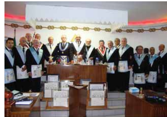
Foto histórica dos 120 anos.