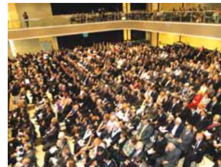
Vista panorâmica do plenário

Presidente da República, Professor FERNANDO HENRIQUE CARDOSO aborda o tema: A ATUAL CONJUNTURA BRASILEIRA Uma Análise Política, Social e Econômica, no dia 18 de Fevereiro de 2010.