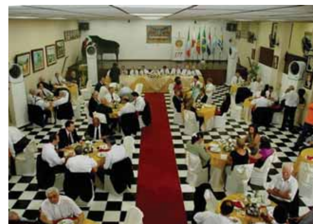
Vista parcial do salão durante a comemoração

1976, no prédio da Rua do Lavradio nº 97, na cidade do Rio de Janeiro, sede do Grande Oriente do Brasil. Atualmente, tem sede no Campo de São Cris-