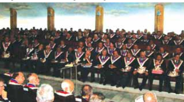
Vista parcial do Plenário da SAFL na última reunião do dia 05/12