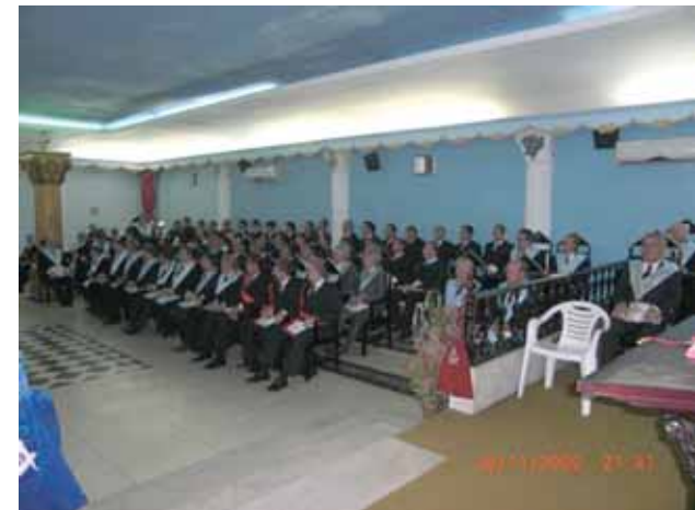
Vista do plenário

ros; onde a luta republicana ganhou espaço e força. Nessa época, a vida política da Vila da Constituição (Piracicaba). Elegera-se Prudente, como Presidente da Câmara Municipal em 1864, pelo Partido Libe-