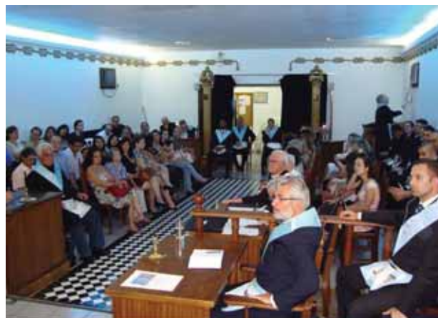
Vista da sessão comemorativa