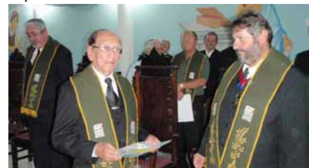
Sessão solene de posse na Academia Paraibana de Letras Maçônicas.