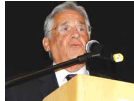
FHC durante palestra

O Grande Oriente de São Paulo, os Obreiros da A.º.R.º.L.º.S.º. Manoel Tarnovschi nº 3322 – GOB/GOSP e o Instituto Acácia de Responsabilidade Social realizaram a Sessão Magna Pública de Palestra com o Excelentíssimo Sr. Ex-