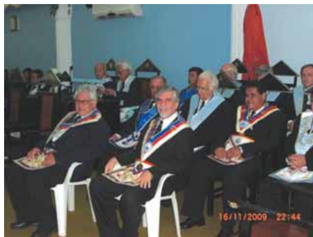
Deputados Federais em visita a loja