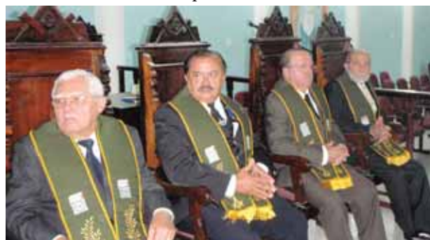
Sessão solene de posse na Academia Paraibana de Letras Maçônicas.