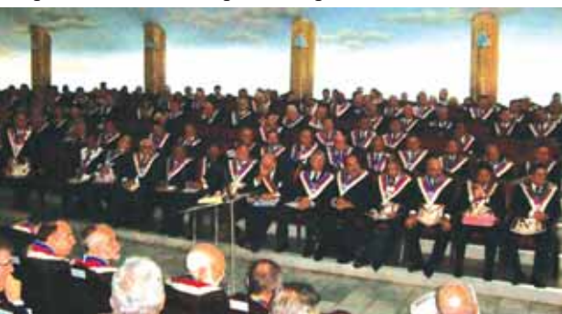
Vista parcial do Plenário da SAFL na última reunião do dia 05/12